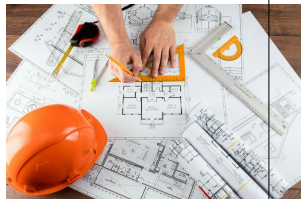
فیگ ۲. نهخشهیان دریژه پی دا