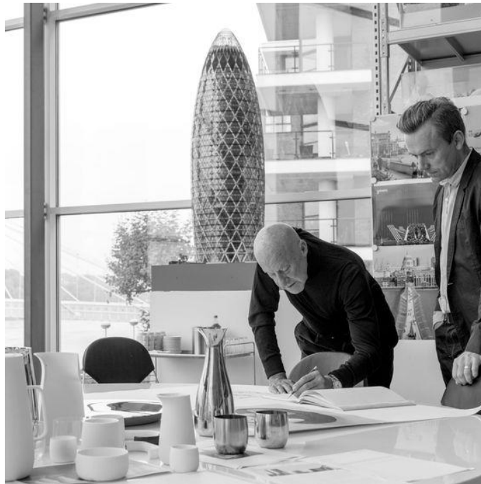
فیگ. ۵. سەرکردایهتی و روانین

نمونه: تهلارسازیکی بینایی یانه لهوانیه بو شایبکی شاری ی دروست بکات که ئاراستهیی داهاتوو پیشبینی دهکات له گوزهران و گواستهوهی شاری.