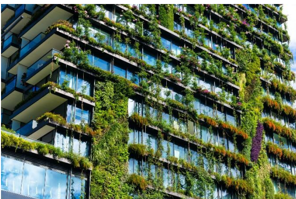
بهکارهینانی کهستهیهک کهتوانای بهردهوامی هیه. ۱. فیگ

تهلارساز ئهوانهی خالی زور بلند تومار دهکن لهسهر بهویژدانی چاودییری کردنی ورد. ئهمه وردی دلنیا دهکات له کرداری دارژتن، بوون به هوئ -بیر دهکاتهوه -دهرچوونچ پلان و ههلهی کهم کردهوه لهماوهی دروست کردن. دریژهی پی دا و بهلگهنامهی دارژتنی گشتگیر موختهملترن تا له تهلارسازان دهر بکهون لهگهل چاویکی بهپهروش بو وردهکاری.