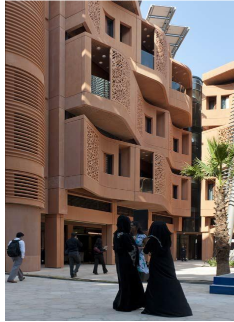
فيگ. ۶. ھۆشيارىي كەلتۈرى