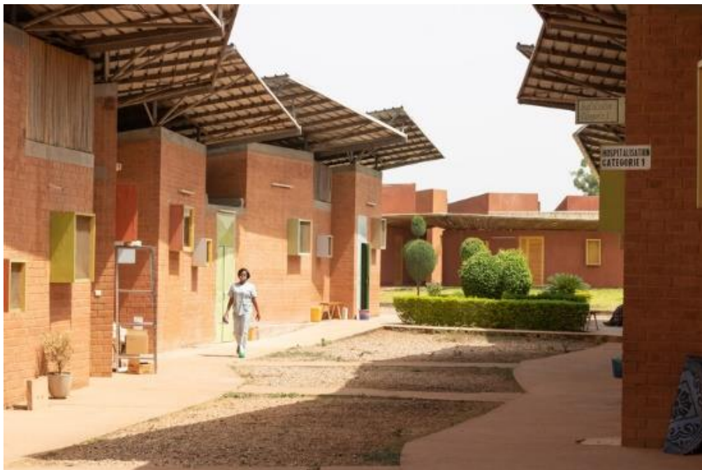
فیگ. ۳ ژینگه‌ی هاریکاری

نمونه: ته‌لارسازیکی ئیکستر افرتید (لی‌هاتوو) له‌وانه‌یه و یرکشوی دارژتن به‌رو بیات له‌گه‌ل نه‌ندامی کومه‌لگه دارژتنی کوتایی دلنیا ده‌کهن پیویسته‌یه‌کان رنگ ده‌داته‌وه و نارمزووی به‌کار به‌ری داها‌توو.